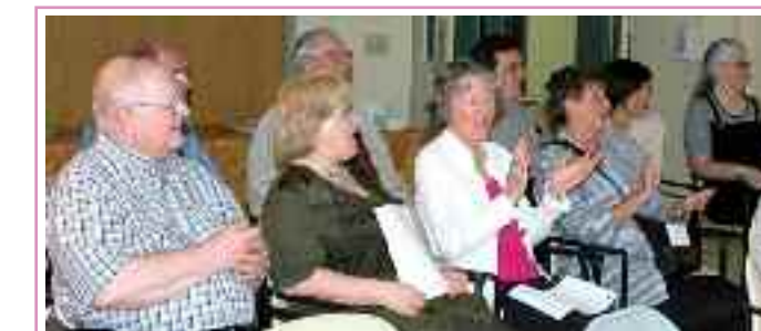
Quelques-uns des participants à l'assemblée générale tenue au Centre d'hébergement Jeanne-Crevier.