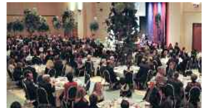
Notre photo-reportage en pages centrales